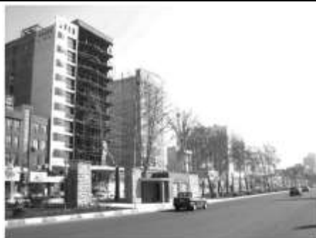
شکل ۶: نمونه‌ای دیگر از ساخت‌وسازهای بزرگ‌مقیاس کرج