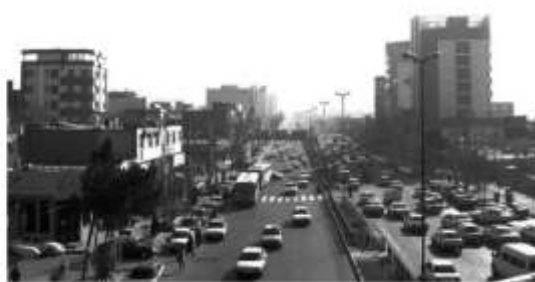
شکل ۱: تصویری از منظر کلی خیابان بهشتی