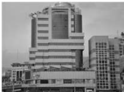
شکل ۹: برج میلاد در خیابان طالقانی، بعد از پل آزادگان