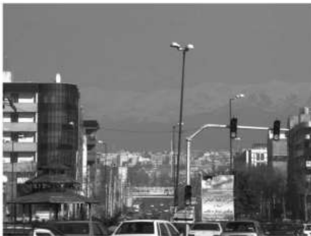
شکل ۱۶: از بین رفتن کریدورهای سبز در بلوار جمهوری

می‌شود، تضاد ارتفاعی آن‌ها، علی‌رغم آنکه آن‌ها را به عنوان یک نشانه در منظر کلان مطرح می‌کند، اما به دلیل آنکه در تضاد هویتی، تاریخی، بصری و کالبدی با زمینه و سایر ساخت‌وسازها هستند، مسائلی را به وجود می‌آوردند. به لحاظ بصری ایجاد خط آسمان ناهماهنگ، از بین بردن پیوستگی بصری و حجمی از یکسو و پیچیدگی صحنه‌ای که ایجاد می‌کنند، منظر را مخدوش می‌نمایند. نمونه این بناها، عبارتند از برج آموت، طالقانی، قائم و میلاد که ضمن آنکه در تضاد زمینه هستند، در ایجاد هویت فرهنگی نیز موفق نیستند (این موضوع به صورت ویژه در بررسی اقتصاد-سیاسی نشانه تحلیل می‌شود).