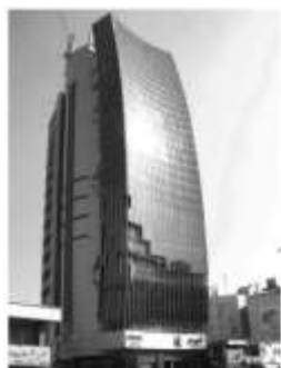
شکل ۸: برج آموت (برج تجاری-اداری) در مرکز شهر کرج