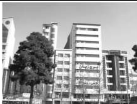
شکل ۵: ساخت‌وسازهای بزرگ‌مقیاس در ساختار اصلی کرج