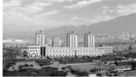
شکل ۱۷: دورنمای کلی و وضعیت قرارگیری مرکز خرید مهستان

مناسبی میان آن دو وجود داشت، در منظر کنونی شهر، این ساختمان‌ها و بلوک‌ها هستند که فضا را شکل می‌دهند. به خصوص در رابطه با ساخت‌وسازهای درشت‌دانه عدم ارتباط منطقی و نبود هم‌آوایی میان توده و فضا به وضوح به چشم می‌خورد (شکل ۱۸).