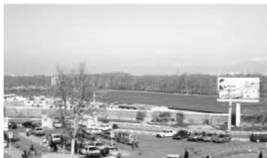
شکل ۱۳: عناصر طبیعی (سبزی‌نگی)

بناها بدون کمترین توجه به ارزش‌های موجود و بافت شکل می‌گیرند. عوامل سیاسی و قدرت نیز نقش و تأثیر خود را بر شهر می‌گذارند. استان شدن شهرستان کرج و فراهم آوردن زمینه‌های تحقق آن در سال‌های اخیر، پیکر شهر را دچار تغییر و تحول کرده است. جذب سرمایه‌گذاران، احداث بناهای بلندمرتبه به منظور تغییر چهره‌ی شهر از نموده‌های چنین رویکردی است. در عین حال نبودن برنامه و به تعویق افتادن تصویب طرح تفصیلی با تمام کاستی‌های طرح مصوب، به موارد مذکور دامن زده است.