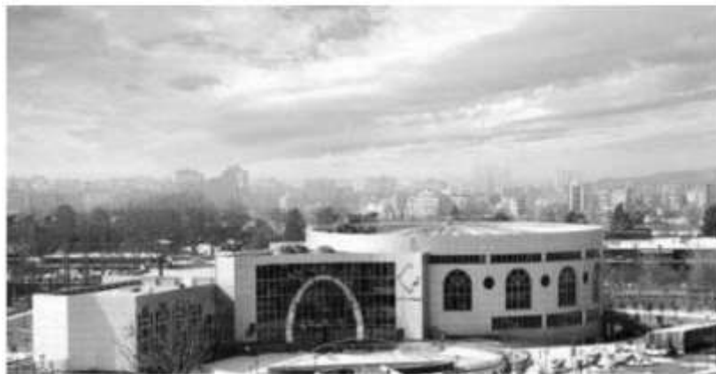
شکل ۱۵: نمونه‌ای از ساخت‌وساز بزرگ‌مقیاس در باغ فاتح (تالار نژاد فلاح)

شود. به نظر می‌رسد در میان لایه‌ها، لایه عوامل انسانی به‌عنوان لنگر، قابل بررسی است. بارت از مفهوم «لنگر» ۱۴ برای لایه‌های اصلی‌تر بهره می‌گیرد؛ به عبارتی از نظر وی، برخی از عناصر متن می‌توانند حکم لنگری تثبیت‌کننده را بازی نمایند و جلوی شناوری نشانه‌های متنی را بگیرند (چندلر، ۱۳۸۶). بدین ترتیب این لایه به‌عنوان یک لایه اصلی ضمن تأثیر بر هر یک از لایه‌های متنی، رابطه متقابل میان لایه‌ها را نیز تحت تأثیر قرار می‌دهد. در ادامه به منظور تحدید کردن بررسی میزان تأثیرگذاری‌ها، با توجه به نمونه موردی پژوهش، تأثیر متقابل ساخت‌وسازهای بزرگ‌مقیاس بر لایه‌های متنی منظر شهر مورد تحلیل قرار می‌گیرد. همچنین در این بررسی تقابل میان عناصر لایه‌های متنی عوامل مصنوع نیز مورد توجه قرار می‌گیرد. لازم به ذکر است که بررسی تقابل‌ها، شیوه‌ای در بررسی نشانه‌شناسی است (همان‌طور که سجودی بیان می‌کند، نشانه هم به مانند متن، مفهومی تکراری است و دارای ساختی سلسله‌مراتبی است (سجودی، ۱۳۸۷)). بنا بر گفته چندلر، ساختارهای سلسله‌مراتبی ناشی از تقابل‌های دوگانه هستند؛ این فهم از ساختارهای سلسله‌مراتبی زمینه‌ی مناسبی را برای شناسایی ساختارهای درونی لایه‌ها فراهم می‌کند. متن صریح وی در بیان این موضوع