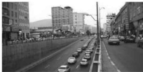
شکل ۲: تصویری از منظر کلی خیابان بهشتی

شهر کرج منجر شده است، می‌توان ساخت‌وسازهای گسترده را در مرکز شهر و منطبق بر ساختار اصلی مشاهده نمود (ساختار شهر کرج را ۲ خیابان متقاطع شکل می‌دهند: خیابان بهشتی (شرقی-غربی) و خیابان طالقانی (شمالی-جنوبی)). این ساخت‌وسازها به دلایل متعددی زمینه بروز یافته‌اند (نبود برنامه، توجیه اقتصادی، ابعاد سیاسی (استان شدن) و...). این