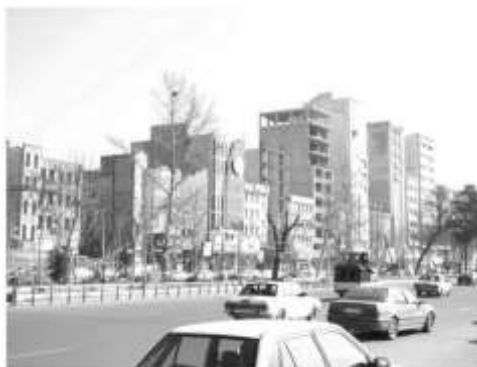
شکل ۱۲: ساخت‌وسازهای بلندمرتبه در ساختار اصلی شهر کرج

لایه‌ی عوامل مصنوع در منظر شهر کرج، شامل ساخت‌وسازهایی هستند که اغلب به چند صورت کلی قابل شناسایی هستند، برخی از ساخت‌وسازهای حاشیه‌ای و واجد ارزش هستند. گونه دیگری از ساخت‌وسازها را می‌توان، ناشی از روند سرمایه‌داری، نیاز به مسکن و بهره‌وری اقتصادی از زمین دانست که به صورت گسترده در حال دگرگونی منظر شهر در مقیاس‌های مختلف هستند. این نمونه از ساخت‌وسازها