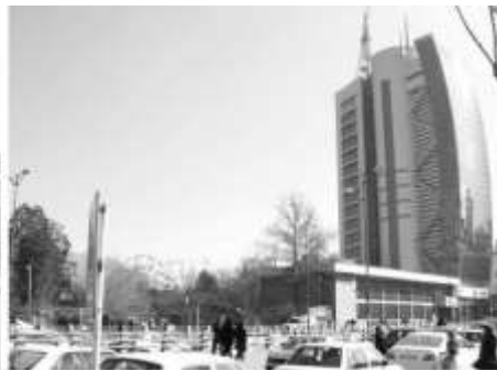
شکل ۱۸: تقابل میان ساخت‌وسازهای بلندمرتبه و فضای اطراف در منظر شهر

اقتصاد سیاسی نشانه‌ی بودریار استفاده می‌شود و شرح داده می‌شود چگونه تأثیر عوامل سیاسی-اقتصادی منجر به ایجاد نشانه‌هایی غیرفرهنگی در شهر کرج شده است که منظر فرهنگی و هویت در منظر را مخدوش نموده است؛ بنابراین در ابتدا توضیحی اجمالی در رابطه با این رویکرد ارائه می‌شود.