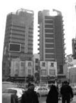
شکل ۷: برج طالقانی (برج تجاری-اداری) در مرکز شهر کرج