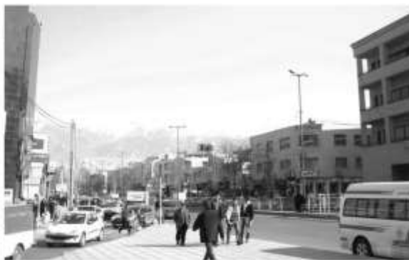
شکل ۳: تصویری از خیابان طالقانی

گرفته‌اند، عبارتند از: برج تجاری-اداری آموت، طالقانی، مجموعه نژاد فلاح و سایر برج‌های مستقر در این محور. همچنین ساخت‌وسازهای انجام شده در محور طالقانی عبارتند از برج قائم ۱ و ۲ و برج میلاد. در ادامه به منظور بررسی تأثیر این ساخت‌وسازها بر منظر کلان شهر کرج، در ابتدا لایه‌های متنی منظر شهر کرج شناسایی می‌شوند (شکل‌های ۵ تا ۹).