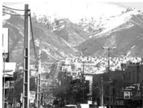
شکل ۴: تصویری از خیابان طالقانی