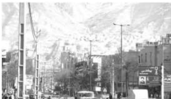
شکل ۱۴: قرار گرفتن در کوهپایه

-لایه‌ی عوامل طبیعی: برخی از عناصر موجود در این لایه متنی که واجد ارزش هستند و در گذر زمان و در فرآیند زمانی دچار تغییر و تحول شده‌اند، عبارتند از پوشش گیاهی و سبزی‌نگی موجود در شهر کرج که آن را به محدوده‌ای بی‌یلاقی تبدیل می‌کرده و نقش مهمی در ادراک منظر کلان داشته است. باغ فاتح واقع در جهان شهر و در محدوده‌ی شمالی محله چهارصد دستگاه، نمونه‌ای از این عناصر در محدوده‌ی مرکزی شهر کرج هستند که در روند گسترش شهر کرج تخریب شده‌اند. در کنار سایر عوامل طبیعی مورد توجه در منظر، می‌توان از شکل کلی پهنه‌ای که کرج