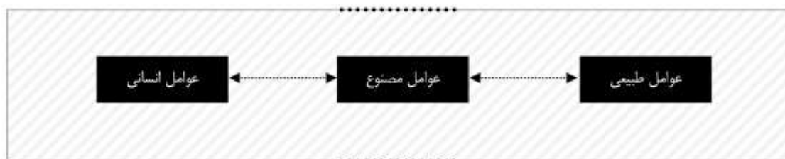
شکل ۱۰: لایه‌های متنی منظر شهر

شناسایی لایه‌های متنی منظر شهر کرج پیش از بررسی نقش نشانه‌ها و عملکرد آن‌ها، در ابتدا لازم است تا لایه‌های متنی منظر شناسایی شود. با توجه به مبانی نظری مقاله، عناصر منظر شهر تبیین شدند. با توجه به ماهیت آن‌ها، می‌توان این متن فرهنگی را واجد سه لایه کلی دانست.