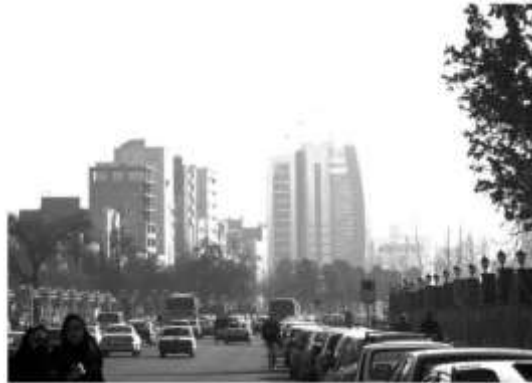
شکل ۱۹: تسلط بناهای بلندمرتبه در منظر شهر