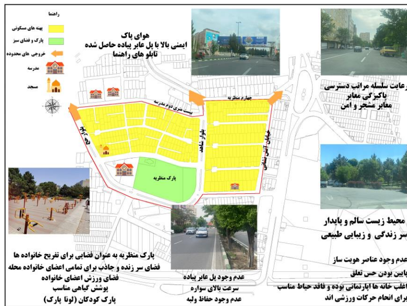
شکل ۳: تحلیل یکپارچه محله منظره شامل مسائل، نیازها و ظرفیت‌های محله مقصودیه از منظر حقوق شهروندی