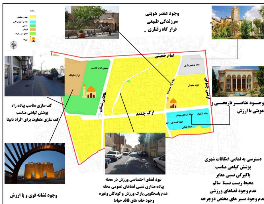
شکل ۲: تحلیل یکپارچه محله مقصودیه شامل مسائل، نیازها و ظرفیت‌های محله مقصودیه از منظر حقوق شهروندی

۱/۶۴۳/۹۶۰ نفر رسیده است که بر این اساس، پنجمین شهر پرجمعیت ایران به شمار می‌رود. محدوده مورد مطالعه، شامل دو محله مقصودیه و منظریه است. مقصودیه یکی از محله‌های مرکزی، شاخص و معتبر منطقه ۸ شهرداری تبریز و در مجاورت کاخ شهرداری تبریز واقع شده است. مرکز محله بر اثر مسیرگشایی و ساختمان‌سازی از بین نرفته و از معدود مراکز محله‌های باقی‌مانده در شهر تبریز است. این محله در گذشته، یکی