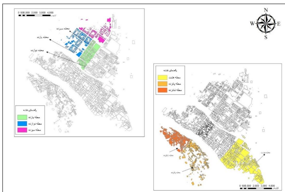
شکل ۲. محلات مطلوب و نامطلوب به لحاظ زیست‌پذیری شاخص مسکن