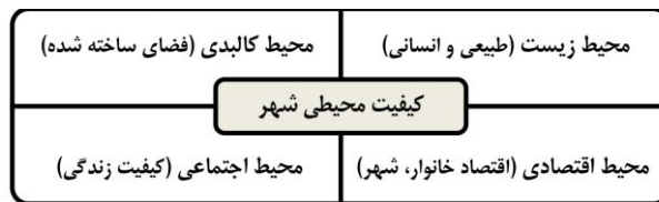
شکل ۱: دیاگرام عمومی کیفیت محیط شهری (Gabriel, 2009)

صرفه‌های بیرونی به وجود آمده و شاهد غلبه‌ی تدریجی مراکز فعالیت و کاربری‌های ناسازگار بر بافت‌های سکونتی، کمبود نسبی خدمات محله‌ای و همچنین فشردگی کالبدی در منطقه شده، که همین امر تا اندازه زیادی سبب نادیده گرفتن محیط‌های سکونتی و کیفیت محیط شهری در این منطقه از شهر اردبیل شده است. همچنین با فرض اینکه هیچ‌گونه مطالعه و ارزیابی در زمینه‌ی کیفیت محیط شهری در شهر اردبیل انجام نگرفته است، به نظر می‌رسد انجام یک ارزیابی اصولی از کیفیت محیط شهری ضروری باشد. با توجه به این مسائل پژوهش حاضر با هدف سنجش کیفیت محیط شهری در منطقه چهار اردبیل بر آن است که با توصیف و تبیین مفهوم کیفیت، ضمن شناسایی مؤلفه‌های مؤثر بر بهبود کیفیت محیط شهری در منطقه مزبور، شاخص‌های تأثیرگذار و چگونگی ارتباط این شاخص‌ها را در محیط شهری منطقه مورد مطالعه بررسی نماید.