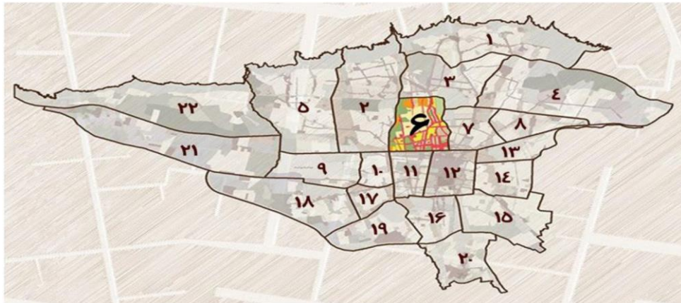
شکل ۱: موقعیت منطقه شش در شهر تهران