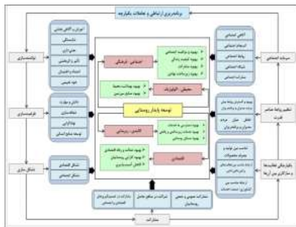
شکل ۲: الگوی بهینه توسعه روستایی

-نگرش مجزا به برنامه‌ریزی شهری و روستایی و یکپارچه نبودن فعالیت‌ها و سازگاری بین آن‌ها در ناحیه مورد مطالعه به‌گونه‌ای بوده که موجب شده پیوندهای روستایی - شهری برقرار نشده از این رو پیشنهاد می‌شود