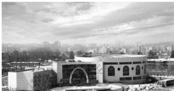
شکل ۱۵: نمونه‌ای از ساخت‌وساز بزرگ مقیاس در باغ فاتح (تالار نژاد فلاح)

یا جفت‌شدگی بسیار کم است، اما در بسیاری موارد، جفت‌ها یا دوگانه‌ها یک سلسله مراتب را شکل می‌دهند (Chandler, 2007)؛ بنابراین در ادامه ضمن بررسی تأثیر متقابل، تقابلهایی که میان لایه‌ها به وجود آمده است در سطح منظر کلان مورد بررسی قرار می‌گیرد. همان‌طور که بیان شد، لایه عوامل انسانی شیوه‌ی ساخت‌وساز را تحت تأثیر قرار می‌دهند، در این میان تأثیر این لایه تقابلهایی را میان دو لایه عوامل مصنوع و طبیعی ایجاد می‌کند. به صورتی که ساخت‌وسازها در مقابل طبیعت قرار گرفته و ضمن تحدید کردن تا سرحد تخریب عناصر طبیعی نیز پیش می‌روند. در ادامه به