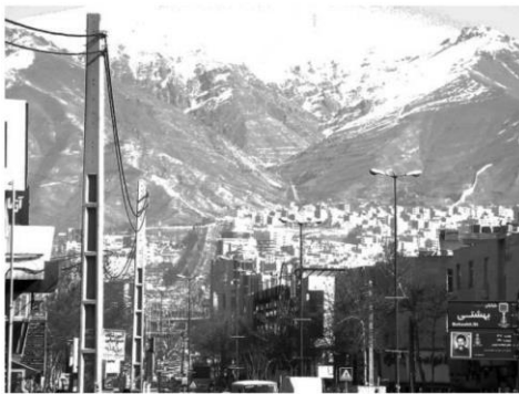
شکل ۴: تصویری از خیابان طالقانی