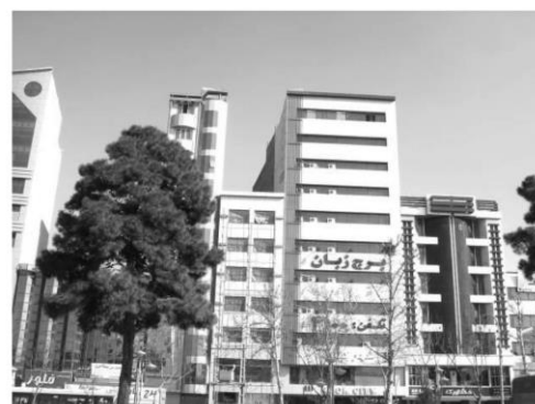
شکل ۵: ساخت‌وسازهای بزرگ مقیاس در ساختار اصلی کرج