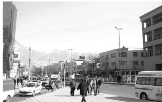
شکل ۳: تصویری از خیابان طالقانی

گرفته‌اند، عبارتند از: برج تجاری-اداری آموت، طالقانی، مجموعه نژاد فلاح و سایر برج‌های مستقر در این محور. همچنین ساخت‌وسازهای انجام شده در محور طالقانی عبارتند از برج قائم ۱ و ۲ و برج میلاد. در ادامه به منظور بررسی تأثیر این ساخت‌وسازها بر منظر کلان شهر کرج، در ابتدا لایه‌های متنی منظر شهر کرج شناسایی می‌شوند (شکل‌های ۵ تا ۹).