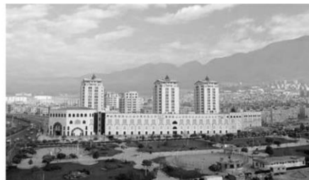
شکل ۱۷: دورنمای کلی و وضعیت قرارگیری مرکز خرید مهستان

مناسبتی میان آن دو وجود داشت، در منظر کنونی شهر، این ساختمان‌ها و بلوک‌ها هستند که فضا را شکل می‌دهند. به خصوص در رابطه با ساخت‌وسازهای درشت‌دانه عدم ارتباط منطقی و نبود هم‌آوایی میان توده و فضا به وضوح به چشم می‌خورد (شکل ۱۸).