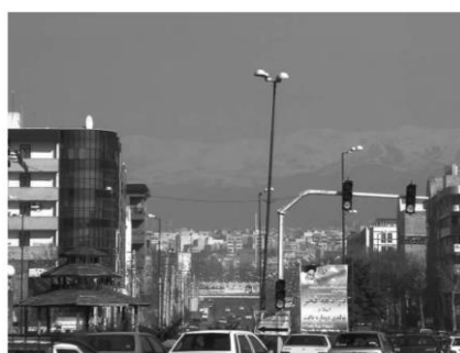
شکل ۱۶: از بین رفتن کریدورهای سبز در بلوار جمهوری

- در عین حال در کنار عناصر طبیعی، می‌توان به تحدید شدن کریدورهای مطلوب بصری در شهر کرج در محدوده مرکزی شهر پرداخت که به واسطه