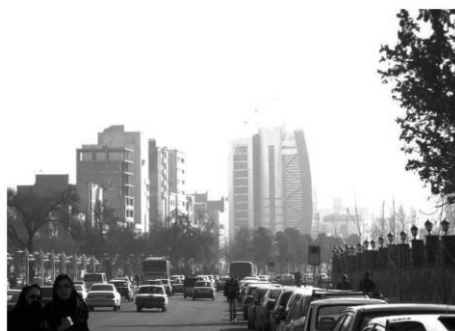
شکل ۱۹: تسلط بناهای بلندمرتبه در منظر شهر

متفاوت بودن نشان می‌دهد که تفاوت در شهر قدمتی برابر با خود شهر دارد؛ برای نمونه، ارسطو بیان می‌کند که شهر مرکب از انسان‌های متفاوت است و افراد شبیه به هم به وجود آورنده شهر نیستند. لویس ویرس (۱۹۶۴)، در نظریه شهرسازی خود می‌گوید ناهمگونی در کنار اندازه جمعیت و تراکم ویژگی تعیین‌کننده‌ای در شهر است. همچنین کارپ، استن و یولز (۱۹۹۱) بیان می‌کنند، زندگی شهری را با جهانی از غریبه‌ها تعریف کرده‌اند (مدنی پور، ۱۳۷۹). با این توضیح مشخص می‌شود، این فضای دارای تفاوت است که به خلق هویت فرهنگی منجر می‌شود و نشانه را تولید می‌کند. مفهوم فضا در تحلیل لوفور کلان بوده و مشتمل