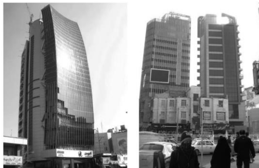
شکل ۸: برج آموت (برج تجاری-اداری) در مرکز شهر کرج