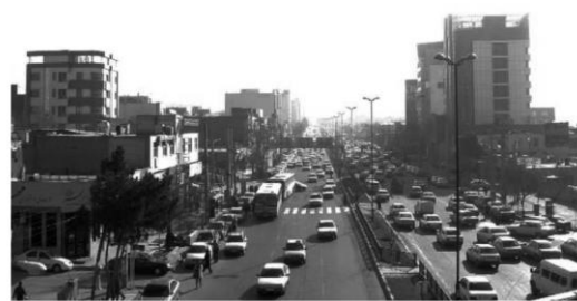
شکل ۱: تصویری از منظر کلی خیابان بهشتی