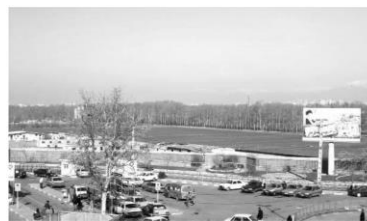
شکل ۱۳: عناصر طبیعی (سبزی‌نگی)