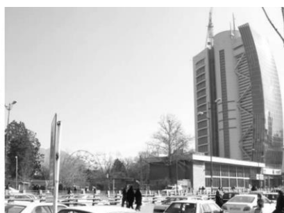
شکل ۱۸: تقابل میان ساخت‌وسازهای بلندمرتبه و فضای اطراف در منظر شهر