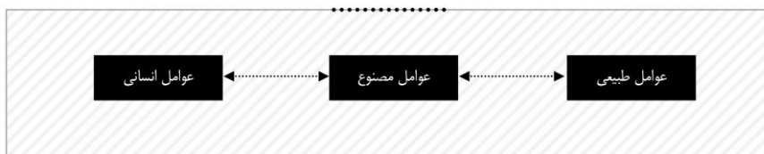
شکل ۱۰: لایه‌های متنی منظر شهر

- لایه متنی عوامل کالبدی: ساخت‌وسازها، فضاهای باز - لایه متنی عوامل طبیعی: شکل زمین، عوامل اقلیمی و عوامل غیر اقلیمی (نور، بو، صدا)، پوشش گیاهی، آب - لایه متنی عوامل انسانی: مشتمل بر فعالیت و رویداد و عوامل سیاسی، اقتصادی، اجتماعی، فرهنگی و... است.