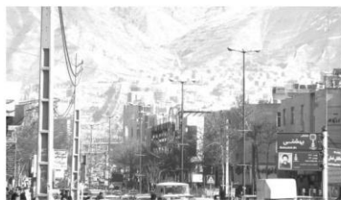
شکل ۱۴: قرار گرفتن در کوهپایه

اهمیت چندانی برخوردار نیست (شکل‌های ۱۳ و ۱۴).