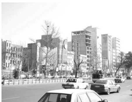
شکل ۱۲: ساخت‌وسازهای بلندمرتبه در ساختار اصلی شهر کرج

- لایه‌ی عوامل مصنوع در منظر شهر کرج، شامل ساخت‌وسازهایی هستند که اغلب به چند صورت کلی قابل شناسایی هستند، برخی از ساخت‌وسازهای حاشیه‌ای و واجد ارزش هستند. گونه دیگری از ساخت‌وسازها را می‌توان، ناشی از روند سرمایه‌داری، نیاز به مسکن و بهره‌وری اقتصادی از زمین دانست که به صورت گسترده در حال دگرگونی منظر شهر در مقیاس‌های مختلف هستند. این نمونه از ساخت‌وسازها