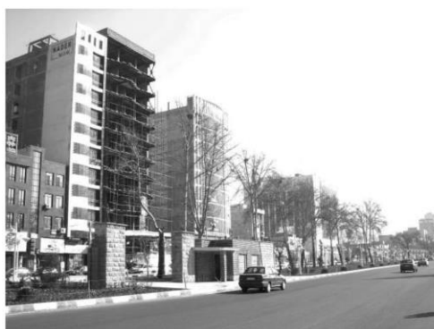
شکل ۶: نمونه‌ای دیگر از ساخت‌وسازهای بزرگ مقیاس کرج

بنابراین در بررسی منظر کلان شهر کرج، تأثیر ساخت‌وسازهای بزرگ مقیاس بر منظر کلان که عموماً در ساختار اصلی و مرکزی کرج شکل گرفته‌اند، مورد تحلیل قرار می‌گیرد. این ساخت‌وسازها اغلب به صورت بلندمرتبه و یا به صورت قطعات درشت‌دانه و با کاربری‌های عمومی (تجاری-اداری) قابل مشاهده هستند. نمونه‌ای از این ساخت‌وسازها که در محور خیابان بهشتی و در اطراف چهارراه طالقانی شکل