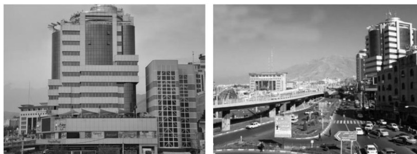
شکل ۹: برج میلاد در خیابان طالقانی، بعد از پل آزادگان