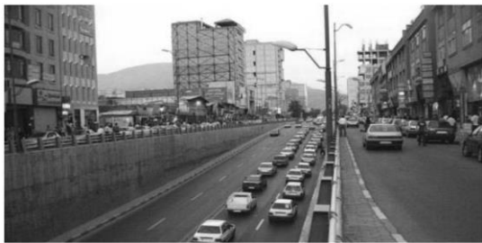
شکل ۲: تصویری از منظر کلی خیابان بهشتی